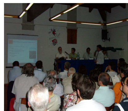
Alcune immagini delle serate informative realizzate.